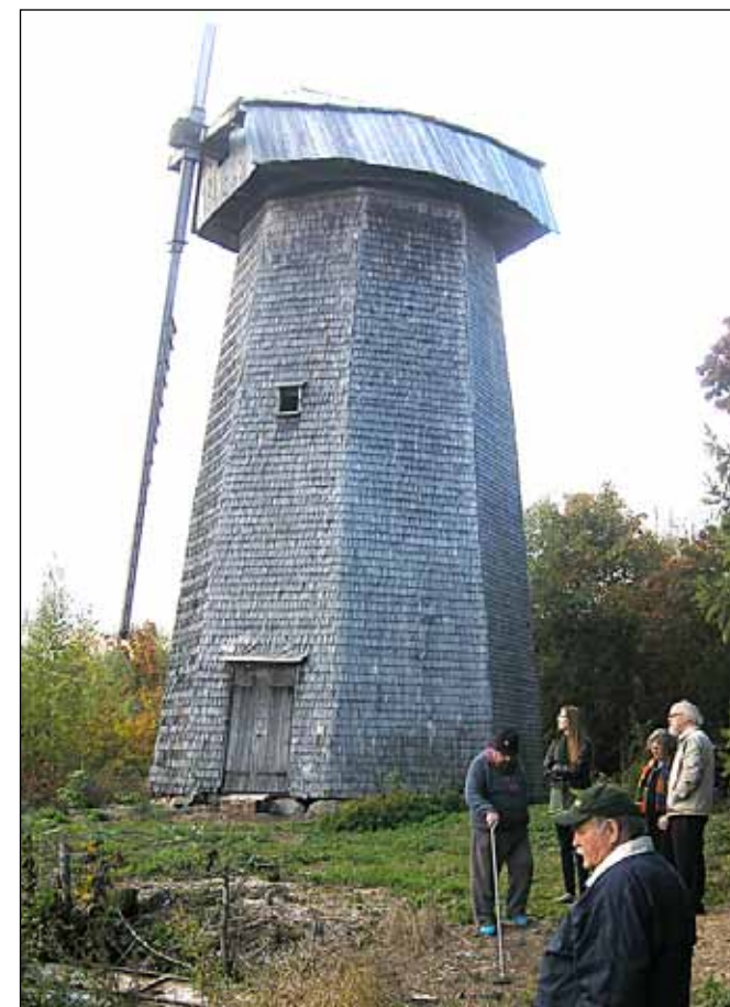
Vesunnan tuulimylly 27.9.2022

Viime aikoina on ollut käynnissä useita hankkeita, joiden tarkoituksena on kehittää koneavusteista tekstin tulkintaa. Koneluvun avulla teksti voidaan muuntaa nykykirjaimiksi ja tehdä siihen sana- ja nimihakuja. Ehkä tulevaisuudes-