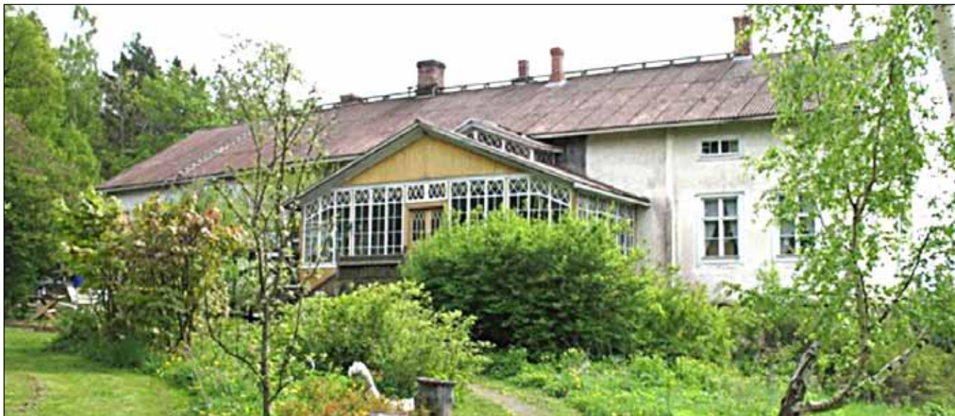
Vesunnan päärakennus.

Arvid sai Vesunnan kuninkaalta vuonna 1566. Vesunnassa oli paljon vaatimattomam- paa kuin Kurjalassa. Kurjala oli idän suunnalla kuten sodatkin. Arvid Tawast ei ollut erityisen innostunut sodista eikä muistakaan kuninkaan