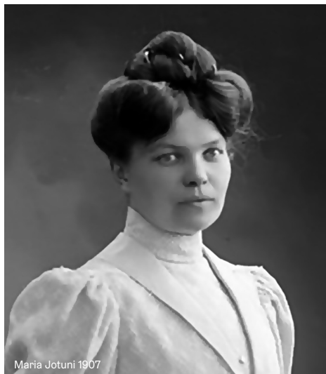
Maria Jotuni 1907